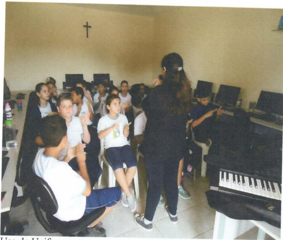
Uso do Uniforme