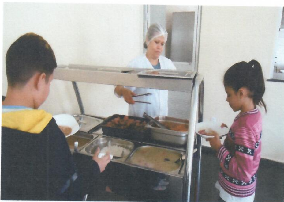
Uso da concha, espuma de madeira e colher de arroz.