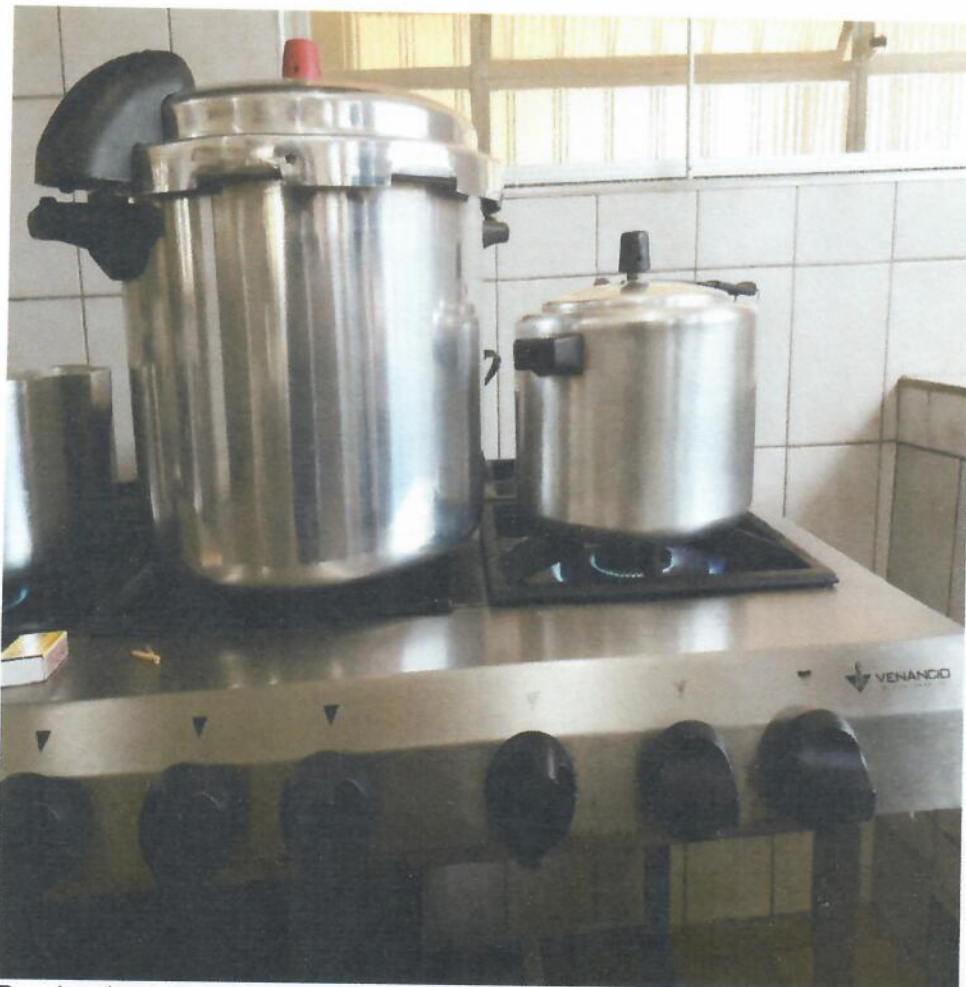
Panelas de pressão