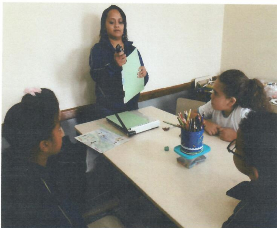
Uso do grampeador