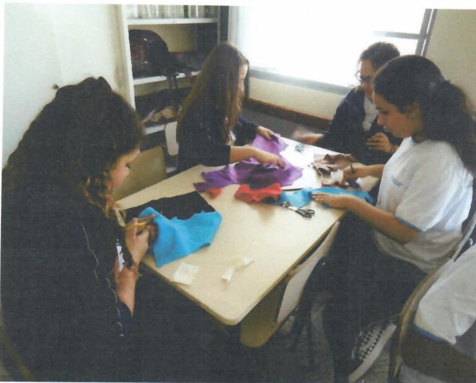
Uso das tesouras nas atividades