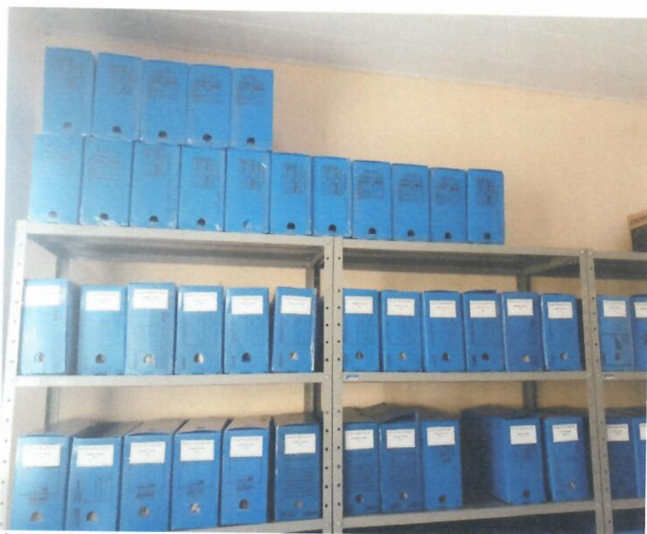
Caixas para arquivo