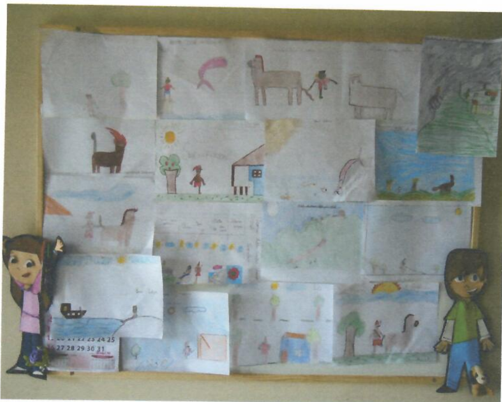
Exposição do Tema Folclore no quadro branco