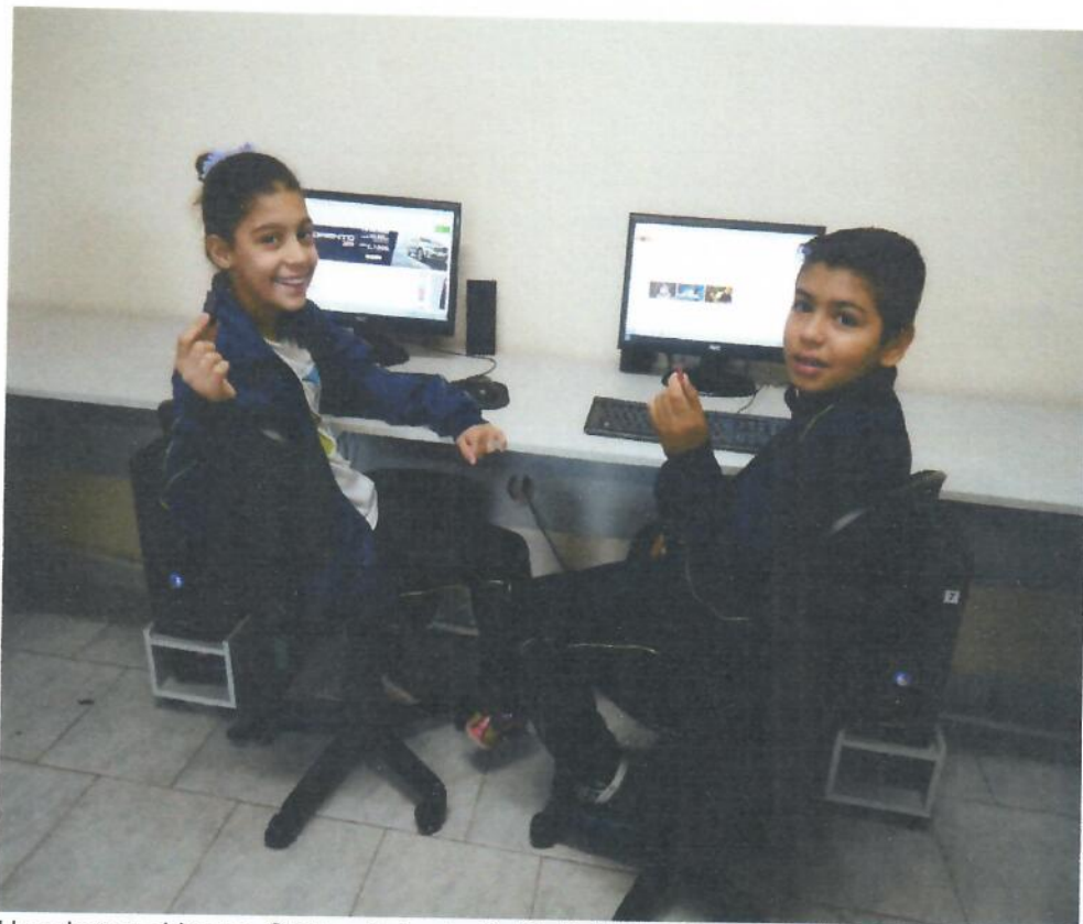
Uso do pen drive na Oficina de Inclusão Digital