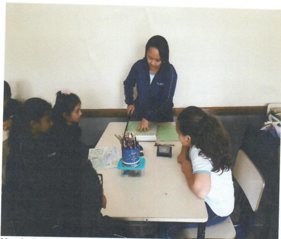
Uso da Guilhotina e furador nas atividades.