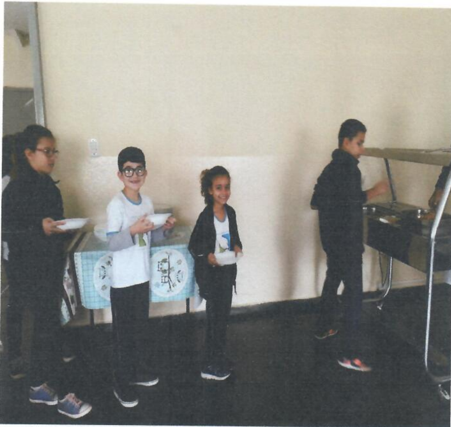
Uso dos pratos nas refeições