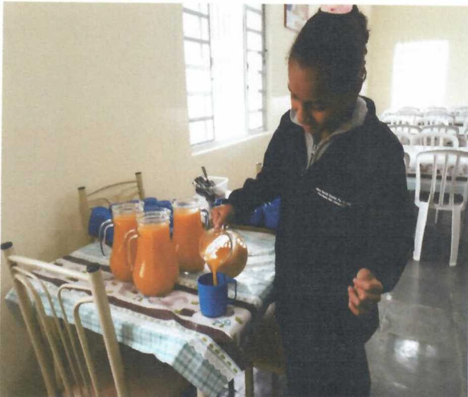
Uso das Jarras